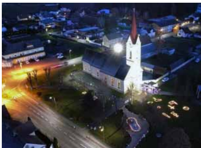
Aus der Luft sind die Symbole in der Wiese gut zu erkennen.

Am Vorabend des ersten Adventsonntags war die Kirche gut gefüllt – nicht nur mit Gottesdienstbesuchern, sondern mit vielen Adventkränzen, die im Rahmen des Gottesdienstes gesegnet wurden. Nach dem Gottesdienst sorgte der Elternverein der Mittelschule Deutsch Goritz wieder für ein gemütliches Beisammensein bei Punsch, Glühwein und kleinen Leckerbissen. Feuerstellen und Musik sorgten für eine angenehme Stimmung. Die Firmlinge haben vor dem Gottesdienst wieder ein Lichterfest gestaltet: viele religiöse Symbole mit Gläsern und Kerzen wurden aufgestellt, die erst nach dem Gottesdienst in der Dunkelheit ihre Wirkung entfalteten. Allen, die mitgewirkt haben, sei hier „Vergelt's Gott“ gesagt.