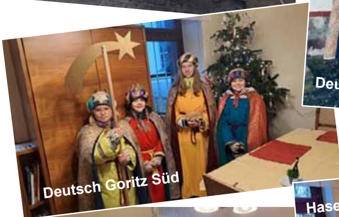
Deutsch Goritz Süd