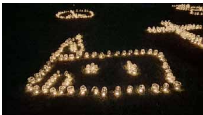
Eines der Symbole aus der Nähe: sofort als Kirche erkennbar.