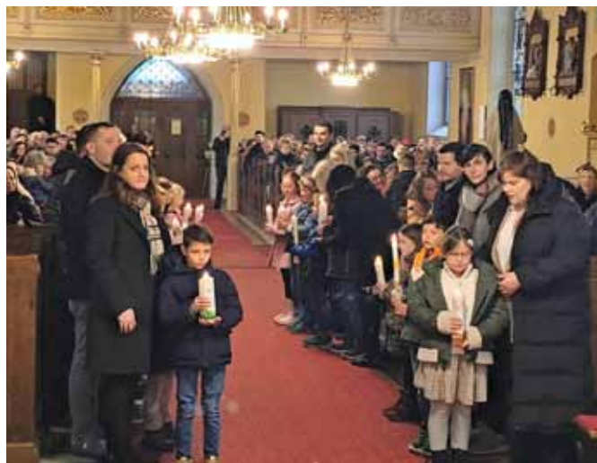
Die Kinder tragen ihre Taufkerzen und stehen mit ihren Taufpaten im Mittelgang der Kirche.