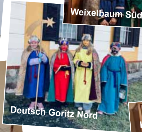
Deutsch Goritz Nord