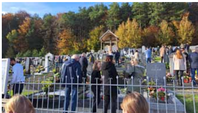
Gräbersegnung am Allerheiligentag 2024